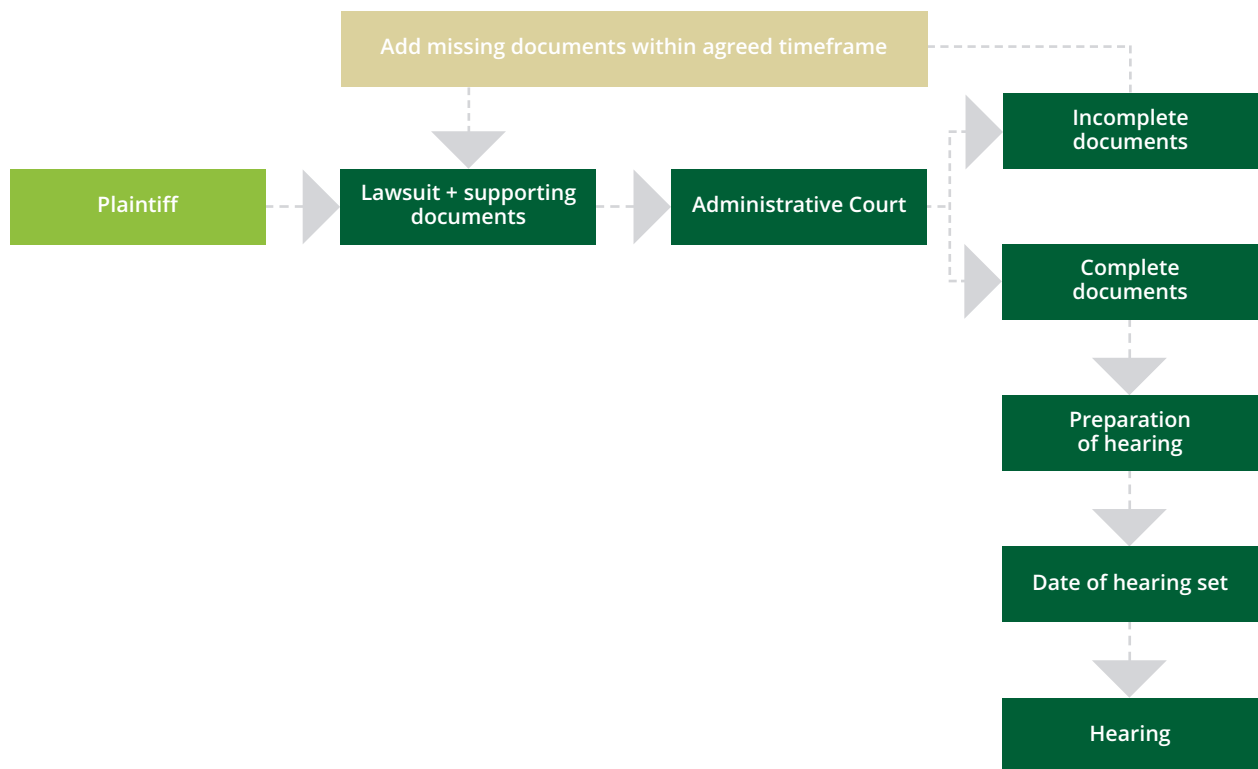
Slika 3. Koraci nakon podnošenje upravne tužbe

Ako Upravni sud rješava upravni spor na osnovu usmene rasprave, onda odlučuje na osnovu činjenica utvrđenih na usmenoj raspravi i činjenica utvrđenih tokom upravnog postupka. Ako Upravni sud na usmenoj raspravi utvrdi da je činjenično stanje drukčije od činjenica utvrđenih u upravnom postupku ili ako nađe da su u tom postupku povrijeđena pravila postupka zbog uticaja odluke o upravnom predmetu, osporeni akt ili drugu upravnu aktivnost poništiće presudom.