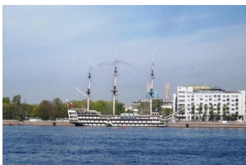
Санкт-Петербург, река Нева