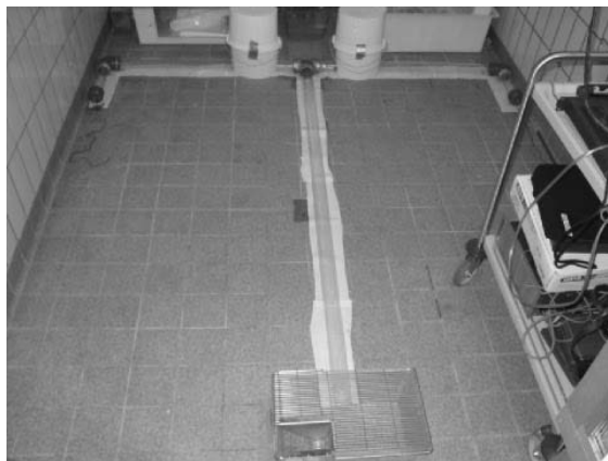
Abb. 1 Versuchsaufbau zur Überprüfung der Schallwirkung auf das Verhalten von Schermäusen. Einzeltiere bewegen sich im T-Labyrinth und können zwischen den beschallten und unbeschallten Enden des ‚T‘ wählen.

Bioakustik: In einem weiteren Ansatz wird mit bioakustischen Methoden gearbeitet. Dabei werden intraspezifische kommunikative Elemente genutzt, die vergrämend auf Schermäuse wirken könnten. Deshalb wurden Tonaufnahmen von Schermäusen beschrieben und auf ihren kommunikativen Gehalt hin untersucht. In einem Vorversuch mit einzelnen Tieren wurde getestet, ob sich bestimmte akustische Elemente auf das Tierverhalten, z.B. die Vermeidung der beschallten Region, auswirken (Abbildung 4). Zeitgleich wurde ein physiologischer Stressparameter überwacht. Aufgrund der positiven Ergebnisse erfolgen z.Z. weiterführende Untersuchungen unter Gehegebedingungen.