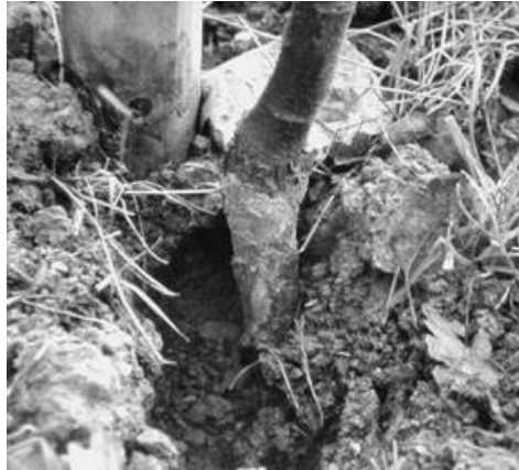
Abb. 2 Schermausschäden durch Schälen der Rinde an der Stammbasis eines Apfelbaums

von etwa 120 € für Ernteausschlag und den Ersatz des Apfelbaums einher. Neben den direkten Fraßschäden wirken im Haus- und Kleingartenbereich die aufgeworfenen Erdhügel auf der Grasnarbe oder in Blumen- und Gemüsebeeten für viele Menschen unästhetisch. In der kommerziellen Grünlandwirtschaft kommt es neben den direkten Ernteverlusten bei starkem Erdauswurf dazu, dass Schmutz in das Mähgut und damit in die Silage gelangt und Fehlgärungen zu verminderter Futterqualität führen. Außerdem müssen vermehrt Wartungsarbeiten an Mähmaschinen durchgeführt werden, weil sich die Mähwerke beim Kontakt mit dem Erdreich stärker abnutzen. Zudem werden die Fehlstellen von Unkräutern besiedelt, was mit weiteren Nachteilen verbunden ist.