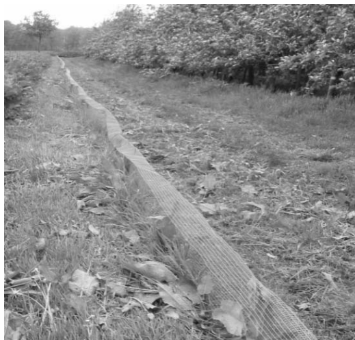
Abb. 3 Barrierezaun

Barrierezäune: Kleinere Flächen lassen sich dauerhaft durch die Anlage von Barrierezäunen schützen, weil die Zäune die Zuwanderung von Immigranten verhindern (Abbildung 3). Maschendraht von 1 m Höhe mit etwa 10 mm Maschenweite wird dazu ca. 50 cm tief eingegraben, 50 cm ragen nach dem Eingraben aus der Erde. Wenn die oberen 10 cm des Maschendrahts nach außen abgewinkelt werden, können Schermäuse nicht über den Zaun klettern. Im Vorfeld oder kurz nach dem Errichten der Konstruktion müssen die Mäuse von der Fläche entfernt werden. Die Wirksamkeit von Barrieren gegen Feldmausbefall im Obstbau ist kürzlich nachgewiesen worden und es konnte gezeigt werden, dass die Barrieren auch ökonomisch sinnvoll sind (Walther and Pelz, 2006). Detaillierte Informationen zur Konstruktion eines Barrierezauns ist unter www.jki.bund.de verfügbar.