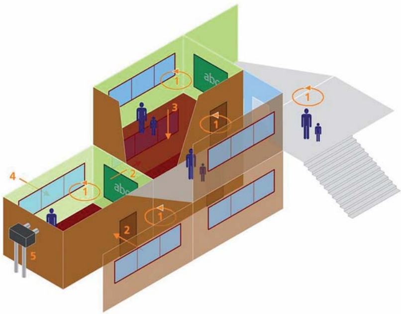
Bild 2: Raumakustische (1 - Nachhallzeit) und bauakustische (2 - Schallschutz von Wänden etc., 3 - Trittschallschutz von Decken, 4 - Schallschutz von Außenbauteilen, 5 - Geräusche von haustechnischen Anlagen) Einflüsse auf die Qualität von Schulgebäuden

In Normen, Richtlinien und anderer Literatur ist eine Fülle und Vielfalt von baulichen Gestaltungsmöglichkeiten zu finden, die sowohl alle Schallschutzaspekte (z. B. DIN 4109) als auch die Einstellung der raumakustischen Bedingungen (z. B. DIN 18041) betreffen. In vielen Fällen, insbesondere bei Neubauten und größeren Sanierungs- oder Erweiterungsmaßnahmen, sollte möglichst ein Akustik-Fachmann hinzugezogen werden.