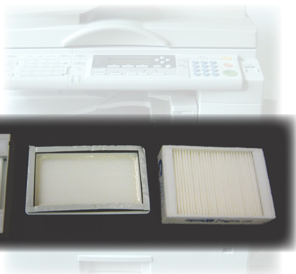
Bild 1: Feinstaub-Nachrüstfilter von drei Herstellern zur Montage an Laserdruckern

Drucker sind heute überall zu finden und aus dem Alltag im Büro und zu Hause nicht mehr wegzudenken. Heute bestimmen Tintenstrahl- und Laserdrucker den Markt. Seit einiger Zeit ist bekannt, dass Laserdrucker außer „gröberen“ Partikeln auch feine (bis 10 Mikrometer* Durchmesser) und ultrafeine („Nanopartikel“) (bis etwa 100 Nanometer** Korngröße) Partikel in die Raumluft freisetzen können. Aktuell stehen besonders die Emissionen und die möglichen gesundheitliche Risiken der ultrafeinen Partikel (UFP) in der öffentlichen Diskussion. Um die Partikelemissionen zu verringern, bieten einzelne Filterhersteller Nachrüstfilter (Bild 1) an, die am Luftauslass des Druckers montiert werden können.