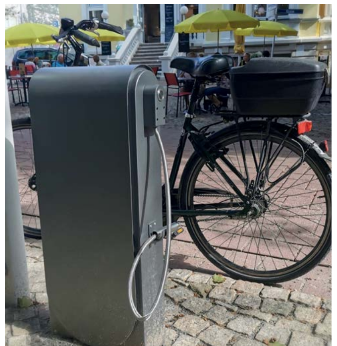
Elektrische Luftpumpe