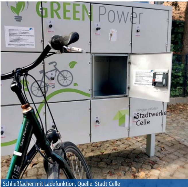
Schließfächer mit Ladefunktion

„Mein Ziel ist es, dem Radverkehr in Celle noch mehr Bedeutung zuzumessen, und das auf allen Ebenen“