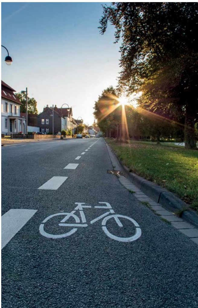
Neue Fahrradschutzstreifen